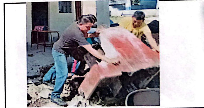
Vista del proceso de retiro de la antigua pila.

Observación: Si es necesario se pueden agregar hojas adicionales y se debe indicar el número de hojas.