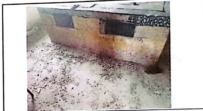
Vista de preparación de base del piso en cocina.