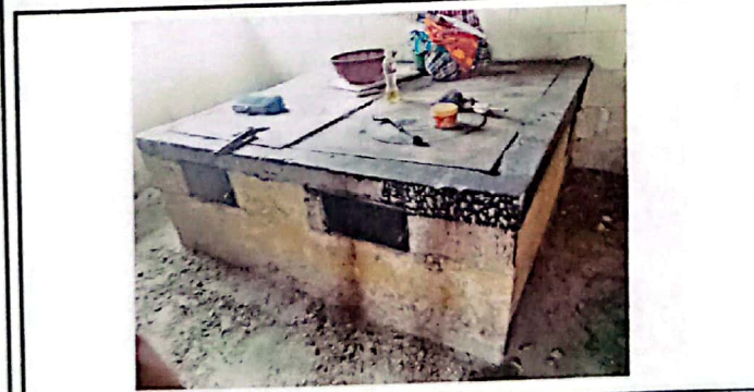
Vista de preparación de la base de la plancha en cocina.