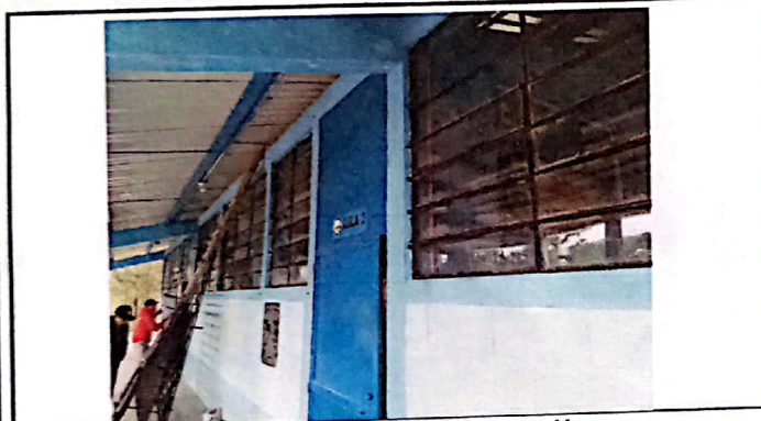
Vista de cuando se instalan balcones en aula y dirección.