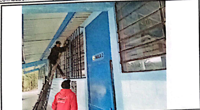
Vista de instalación de balcon en aula