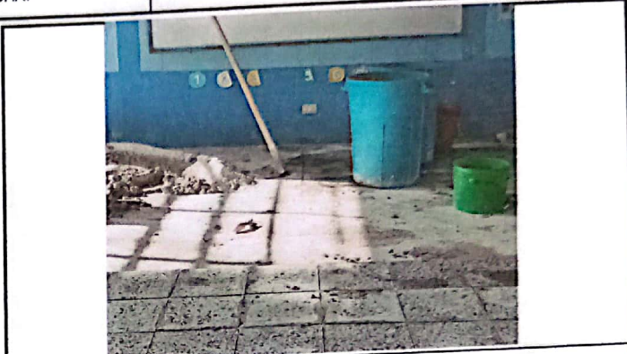
Vista de cuando se está instalando el piso en el aula.